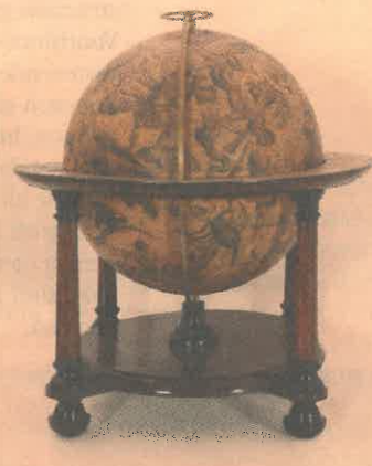
18de-eeuwse globe met de sterrenbeelden.

De Nederlandse verzamelaar wil dat zijn Booncollectie in veilige handen komt.