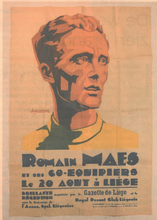
Een poster van de wierlegende Romain Maes.